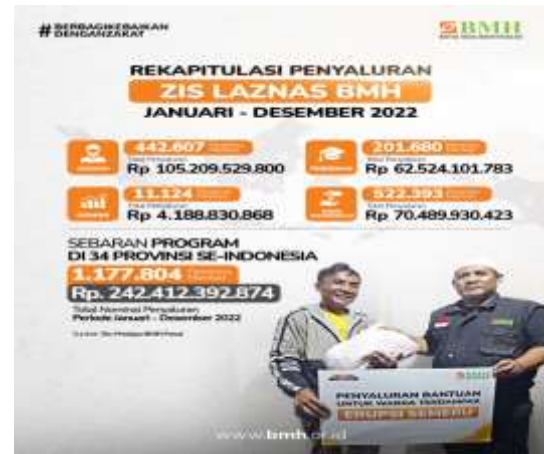
Gambar 3. Kiprah Program Baitul Maal Hidayatullah

Kiprah program BMH dari hasil pengelolaan zakat telah melintasi berbagai daerah di Indonesia, setidaknya 287 Pesantren telah eksis dan juga berkiprah, 5213 Dai Tangguh telah menyebar seantero nusantara, ribuan keluarga dhuafa telah terberdayakan dan mandiri, ribuan anak usia sekolah mendapatkan pendidikan yang layak.