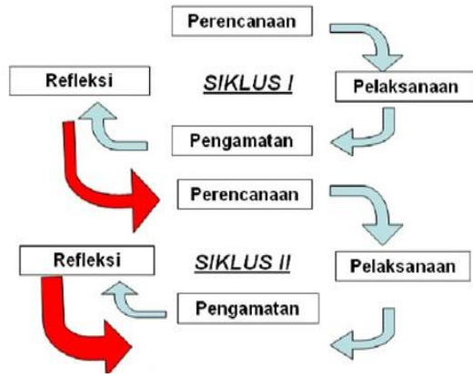
Gambar 1. Siklus PTK Kurt Lewin