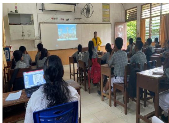
Gambar 3. ProseS Pembelajaran Siklus I

Hal ini menunjukkan bahwa meskipun siswa mulai mampu mengaitkan materi dengan situasi nyata, kemampuan dalam mengembangkan pemikiran secara mandiri masih memerlukan penguatan lebih lanjut.