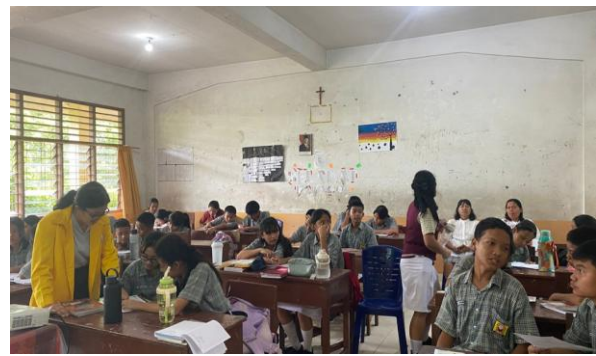
Gambar 5. Proses Pembelajaran Siklus II

Sementara itu, pada indikator keterampilan berpikir kritis dan pemecahan masalah, tingkat ketuntasan mencapai 78%, dengan 22% siswa yang masih memerlukan pendampingan lebih lanjut. Meskipun menjadi indikator dengan capaian paling rendah pada siklus II, hasil ini tetap menunjukkan peningkatan yang signifikan dibandingkan siklus sebelumnya. Secara keseluruhan, hasil siklus II menegaskan bahwa penerapan model CTL tidak hanya mampu meningkatkan keterampilan belajar siswa secara bertahap, tetapi juga membentuk kemampuan berpikir yang lebih kritis, reflektif, dan kontekstual dalam memahami materi pembelajaran.