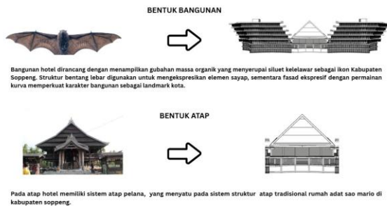
Gambar 3. Konsep Bentuk

Pemanfaatan material lokal, seperti kayu dan batu alam, diterapkan pada elemen fasad maupun interior bangunan guna memperkuat karakter dan identitas lokal sekaligus menciptakan suasana ruang yang hangat dan sesuai dengan konteks lingkungan. Unsur dekoratif serta detail arsitektural dirancang dengan mengadaptasi motif dan pola tradisional Bugis sebagai representasi simbolik dalam upaya pelestarian nilai budaya. Melalui penerapan tersebut, pendekatan Extending Tradition berperan sebagai penghubung antara nilai-nilai tradisional dan kebutuhan arsitektur hotel yang bersifat modern.