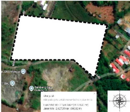
Gambar 1. Tapak yang Terpilih