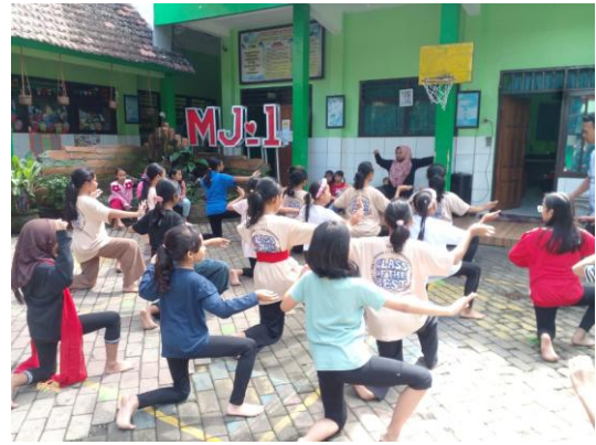
Gambar 2. Latihan Tari Topeng Grebek Sebrang sebagai proses pewarisan kearifan lokal Tarian Topeng Grebek Sebrang di SDN Merjosari 1

sistem sosial budaya. Selain itu, keterlibatan siswa dalam pementasan tersebut turut menumbuhkan rasa bangga terhadap budaya daerah, meningkatkan kesadaran akan pentingnya pelestarian warisan budaya, serta memperkuat hubungan antara sekolah, siswa, dan masyarakat dalam menjaga keberlangsungan tradisi lokal secara berkelanjutan.